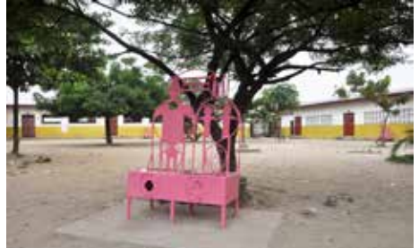
Les Chaises de la Dignité, Hervé Yamguen