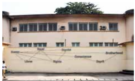
Article n° 1, Mustapha Akrim