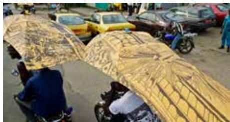
Empreinter les Voix , Chourouk Hriech