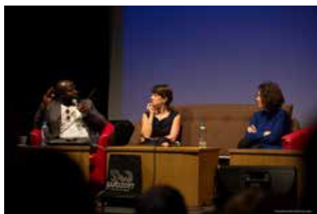
Conférences Ars & Urbis, IFC Douala