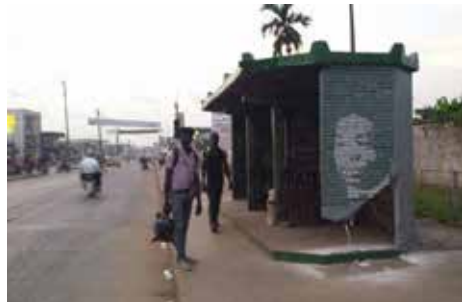
Station de la mémoire , Justin Ebanda