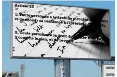
Rewriting the Universal Declaration of Human Rights, Kamiel Verschuren