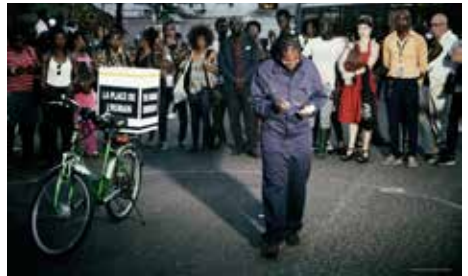
The gift , performance Justine Gaga