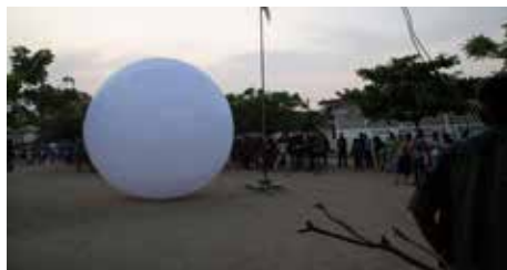
Dream Pressure Tester , The Trinity Sessions